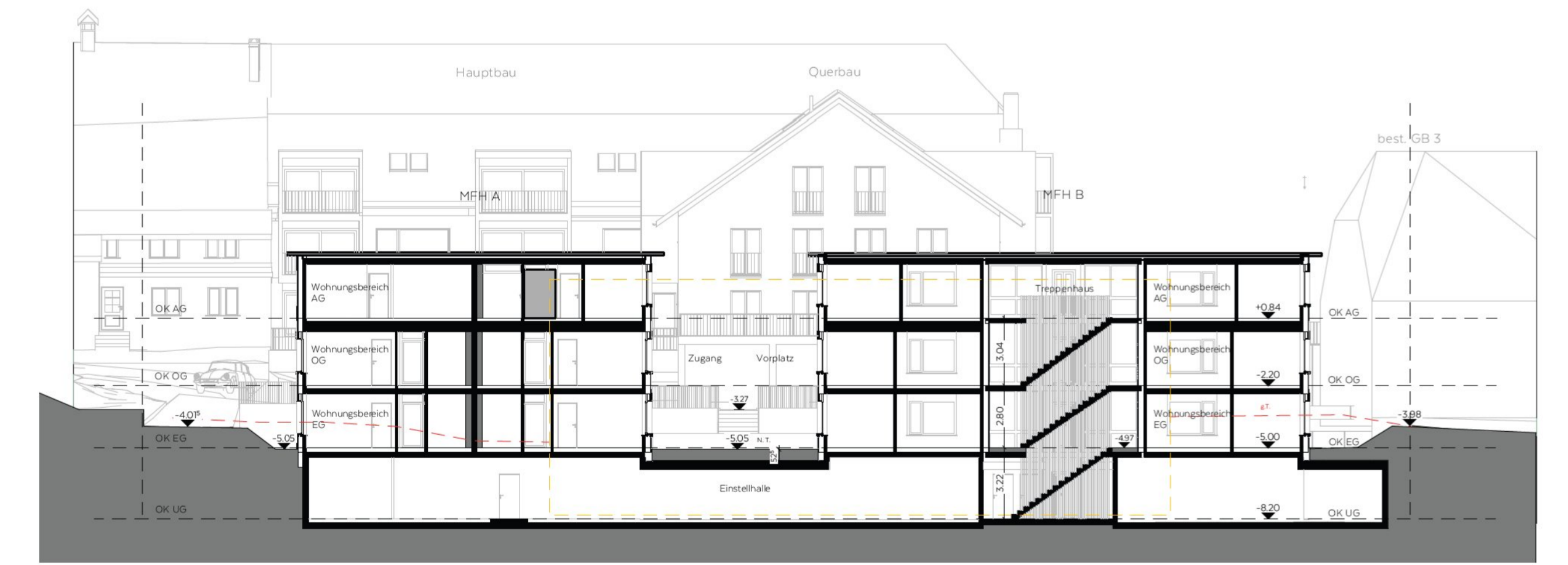
Mehrfamilienhäuser A + B, Schnitt B-B'